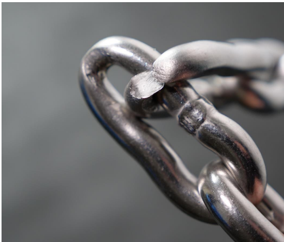
Abbildung 4 Zerreiversuch Materialbruch bei berlast, Schweinaht hlt